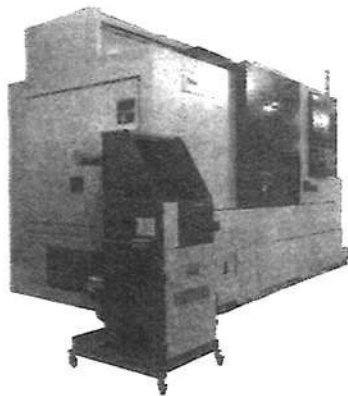
集塵機を工作機械周辺用に特化した「エアブロー作業台 YMS」によって、工場現場を汚さず作業できる

我々は健康で明るい生活と礼節を重んじ、 創意と工夫をもって、高品質、高技術をめざし、 全員一致で常に高い目標を追求し、 限りなき前進を続け社会に奉仕する